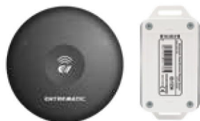
ESC mit Neigungssensor