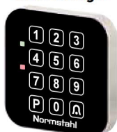
Codetaster Glas Design